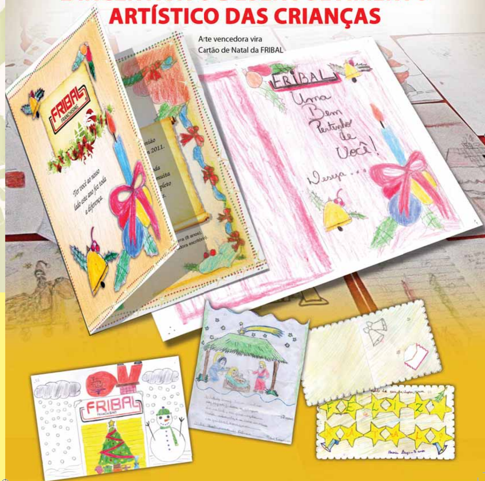
Arte vencedora vira Cartão de Natal da FRIBAL

PROJETO CULTURAL INTEGRAL, EMOCIONAL E INCENTIVA O DESENVOLVIMENTO ARTÍSTICO DAS CRIANÇAS