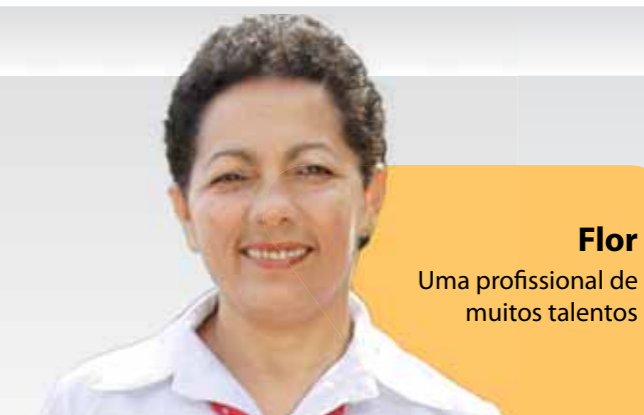
Flor Uma profissional de muitos talentos

O seu bom relacionamento com os amigos de trabalho é algo marcante, está sempre disposta a ouvir e