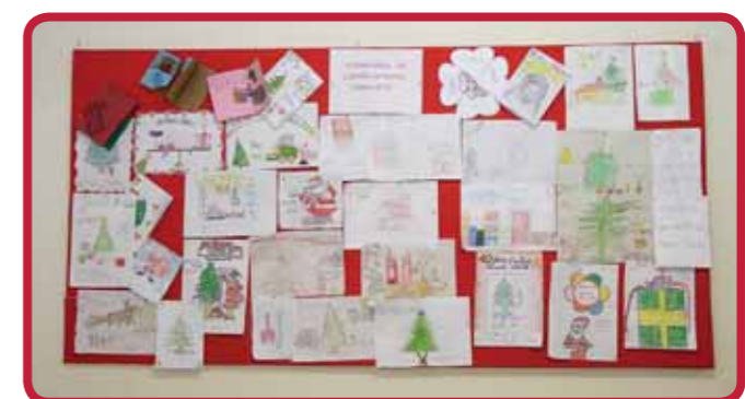
Os desenhos dos participantes do concurso ganharam espaço em mural no auditório da empresa