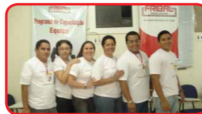
Comissão organizadora da SIPAT São Luís

A Sipat tem o objetivo de orientar e conscientizar os colaboradores sobre a importância da prevenção de acidentes e doenças no ambiente de trabalho para a melhoria da qualidade de vida.