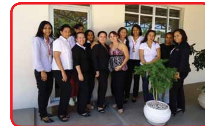
Colaboradoras do escritório

Nas lojas o dia especial também não passou em branco. As colaboradoras receberam um lindo cartão virtual com mensagens parabenizando pela data.