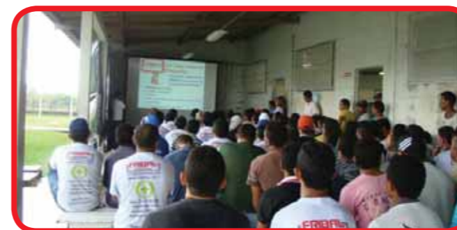
Colaboradores do frigorífico atentos à palestra da SIPAT