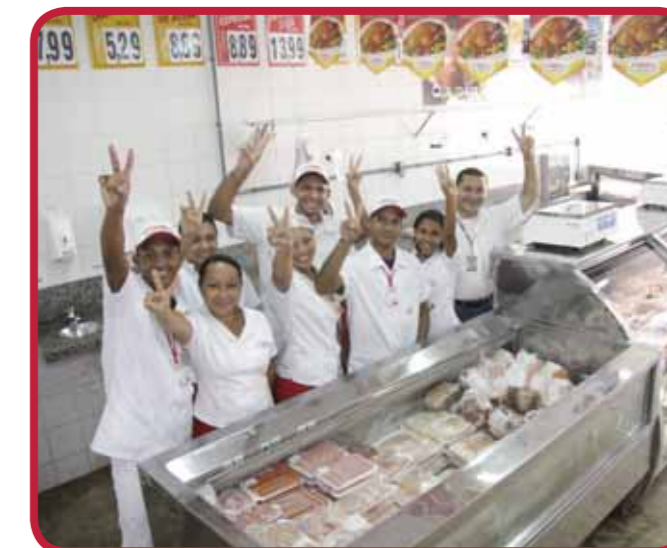
Equipe de colaboradores da loja Paranã

A Fribal Franchising inaugurou no início do ano mais uma loja no município de Paço do Lumiar. A loja localizada no bairro Paranã segue o mesmo padrão das demais garantindo a comodidade, o padrão de atendimento e prestação de serviços de qualidade que a rede adota em todas as unidades.