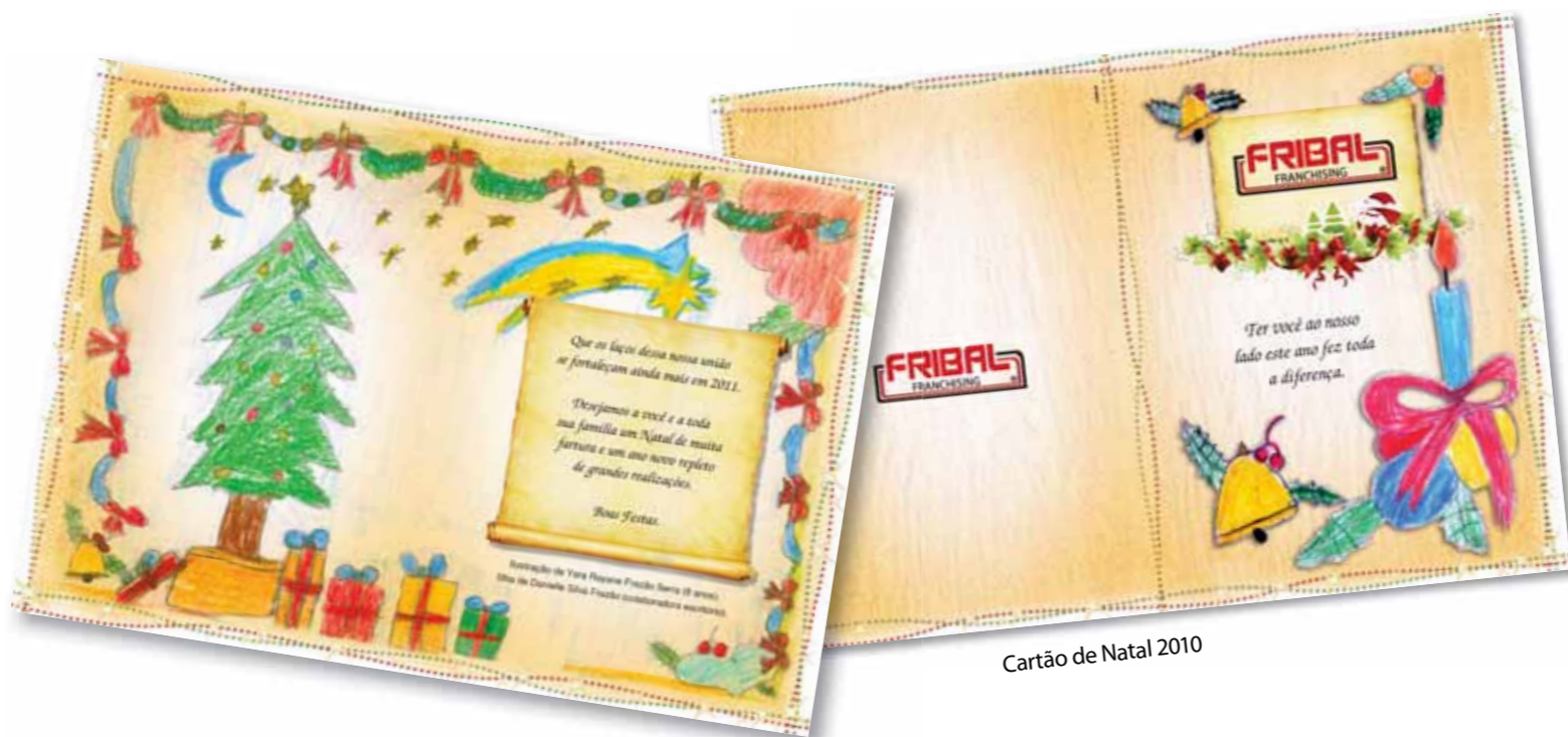
Cartão de Natal 2010

A Fribal agradece e parabeniza todas as crianças, e aos pais que incentivaram seus filhos a participarem do concurso!