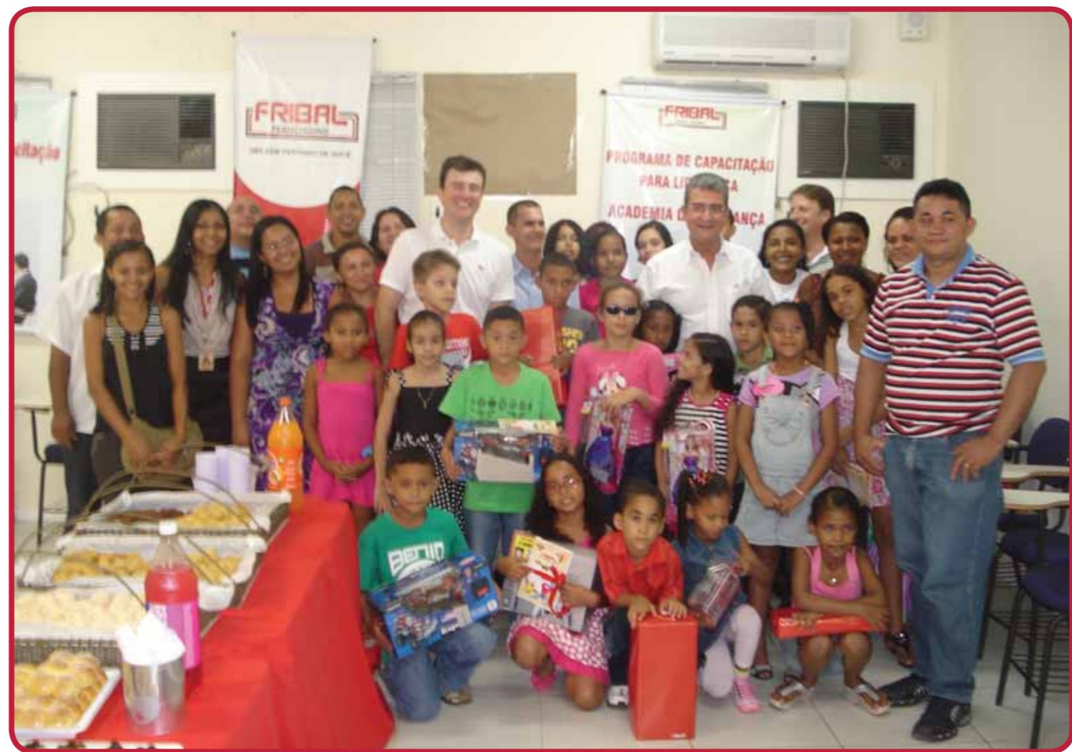
A alegria tomou conta da festa de premiação